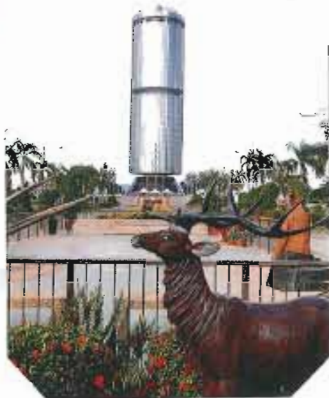
これほどならなくちゃ(笑)

お月夜もいっぱいになり 向かたのよ、 → 「メナラ・タン・ムスタファ」 → 世界的にまっ多い、 まっくなってるビルです。 18階は展望レストラン♡ このシカは、おれに いらっせいます♡♡