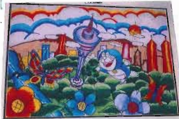
Perlanjutan Mewarna "Cintai Alam Sekitar"

見て下さい! KLタワーと ドラえもん コラボです(笑) マレーシアでドラえもん 見るとは...!!!